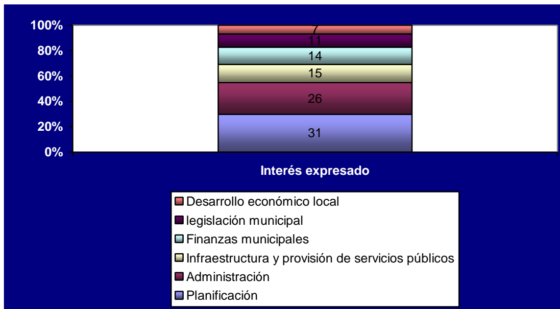
GRAFICO 1 Porcentaje de temas de interés A nivel Regional