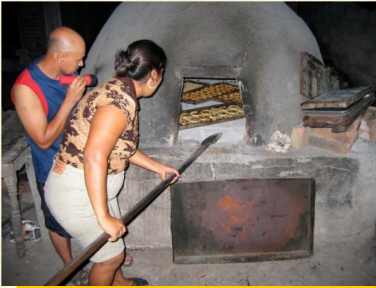
Hombres y mujeres trabajando en la elaboración de quesadillas en hornos artesanales.