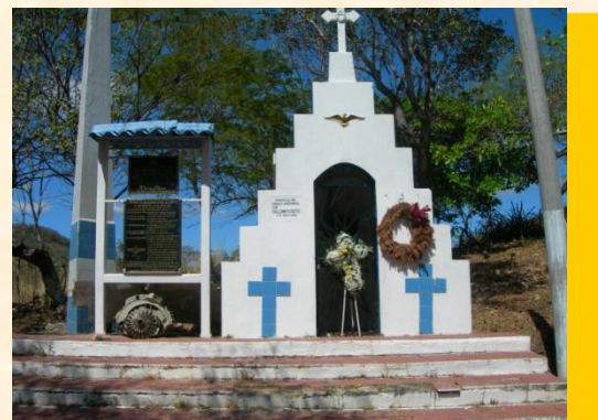
Monumento en honor al Cap. Guillermo Reinaldo Cortez. Parte de la identidad cultural del municipio.

Esta gran obra que se espera esté concluida en los próximos meses, va a ser importante para desarrollar diferentes iniciativas de desarrollo económico de la localidad como es convertirse en un destino turístico para compartir con los visitantes la riqueza histórica que tiene el municipio, por mencionar alguna, haber sido el sitio donde cayó el Héroe Nacional Cap. Guillermo Reinaldo Cortez, durante la guerra de las "Cien Horas", entre El Salvador y Honduras, el 16 de Julio de 1969.